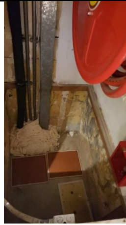
經封洞後，未有發現鼠蹤