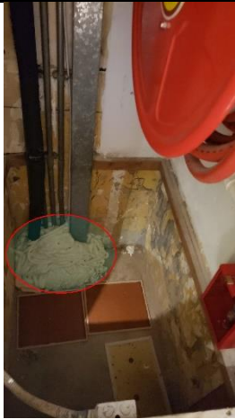
消防喉轆槽發現有洞(紅圈示)建議封洞