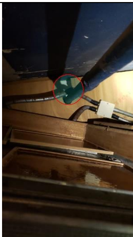
經檢查後假天花管道附近有洞(紅圈位置)，高機率出現老鼠活動

而在不適宜使用鼠餌的情況下，我們會設置捕鼠膠板或老鼠籠以達至殺滅及捕捉老鼠，防止它們進一步繁殖及擴散，做成屏障。然後我們會定期檢查工作成效，檢查及於適當位置放置或更換老鼠板/籠。有需要時會調整或更改防治方法。