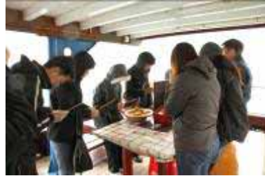
進行簡單悼念儀式