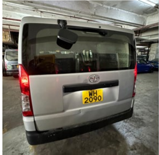
柴油輕型貨車的後方