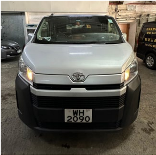
柴油輕型貨車的前方