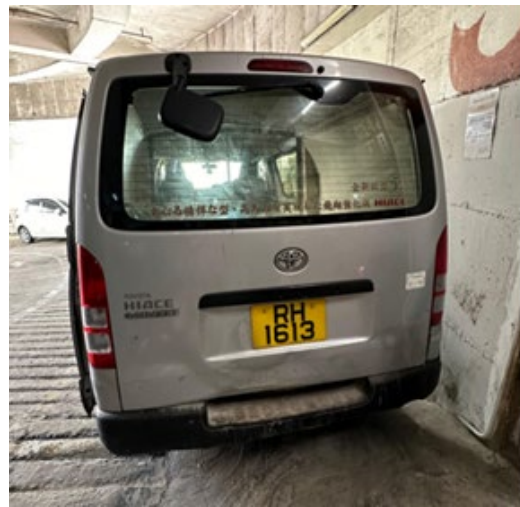
柴油輕型貨車的後方