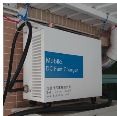
30 千瓦直流充電裝置 #2