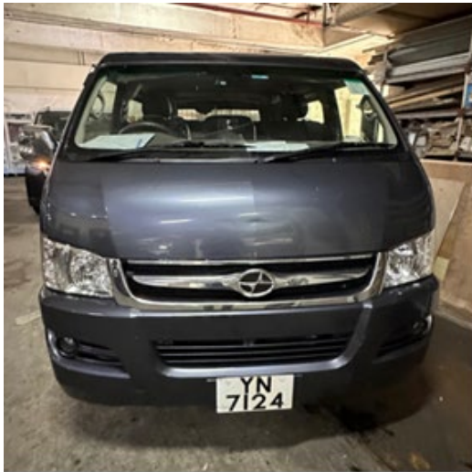
電動輕型貨車的前方