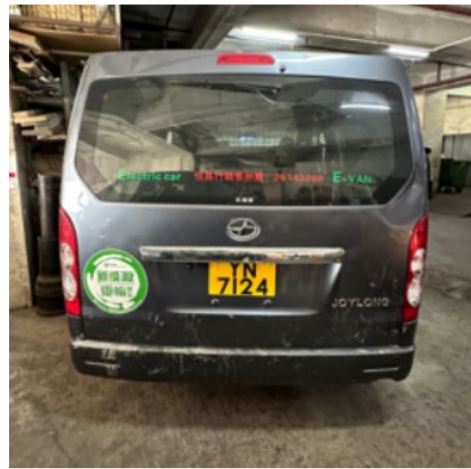
電動輕型貨車的後方