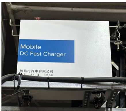
30 千瓦直流充電裝置 #1