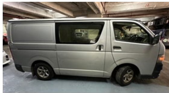
柴油輕型貨車的右側面