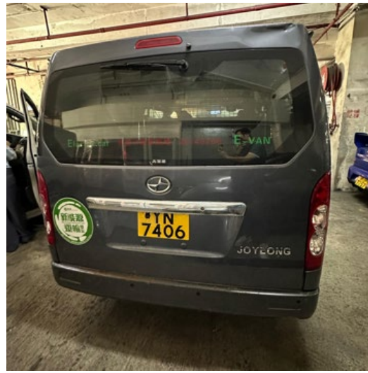
電動輕型貨車的後方