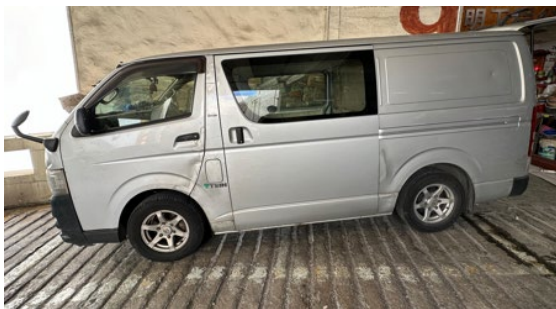
柴油輕型貨車的左側面