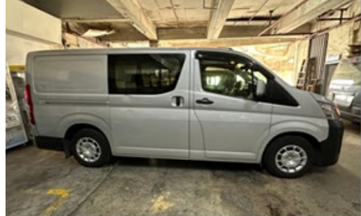
柴油輕型貨車的右側面