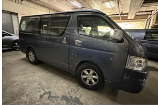
電動輕型貨車的右側面