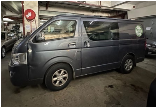
電動輕型貨車的左側面