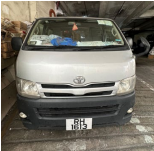
柴油輕型貨車的前方