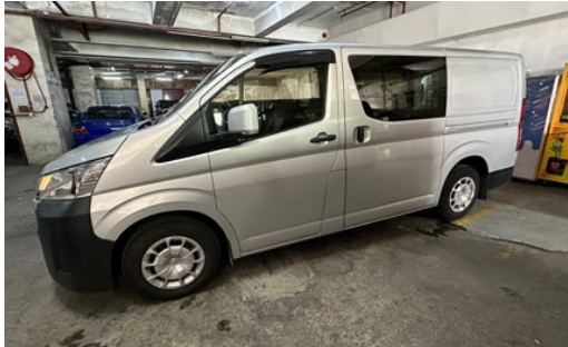
柴油輕型貨車的左側面