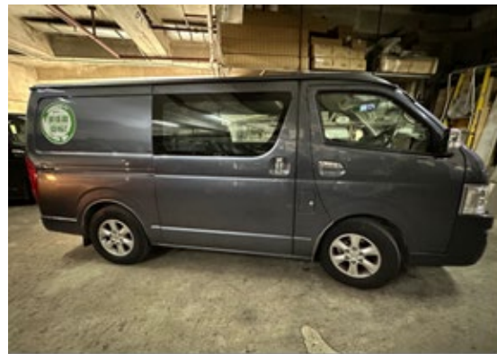
電動輕型貨車的右側面