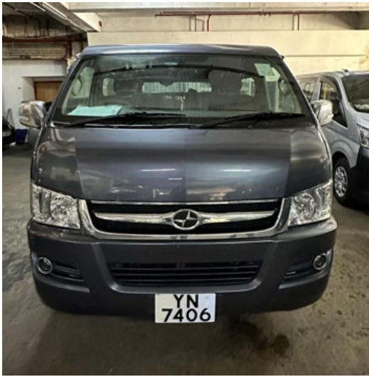
電動輕型貨車的前方